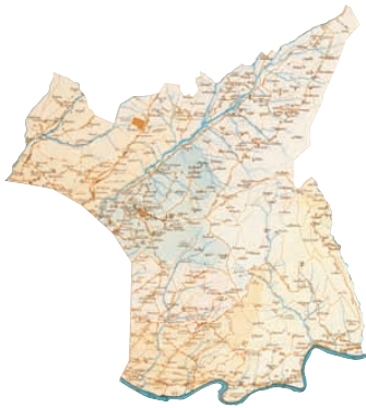
Mappa topografica del territorio comunale, nei confini che ebbe dal 1865 al 1910

celleria. La prassi di concentrare le carte di tutte le comunità sottoposte al controllo di un cancelliere in un unico archivio, che risiedeva nella sede della cancelleria, ha comportato l'affluenza e la conservazione a Fiesole di documentazione relativa anche alle altre comunità sottoposte all'autorità di questo funzionario statale. Con la trasformazione delle cancellerie comunitative in cancellerie del censo, ai cancellieri vennero affidati compiti di natura essenzialmente erariale ma furono mantenute le tradizionali funzioni in materia di custodia degli archivi delle comunità e di consulenza agli organi deliberativi degli enti compresi nelle rispettive circoscrizioni. Abolite nel 1865 anche le cancellerie del censo, le carte conservate nell'archivio del cancelliere di Fiesole subirono passaggi di mano e smembramenti: il primo marzo 1866 i sindaci di Fiesole, Sesto e Brozzi ricevettero in consegna le filze ed i registri che andranno a costituire i rispettivi archivi comunali. Nonostante gli smembramenti, una parte consistente delle carte del cancelliere e anche di quelle dell'ingegnere di circondario, altra istituzione di controllo del territorio a carattere sovracomunale, rimasero nell'archivio comunale di Fiesole per l'impossibilità di dividere fisicamente la maggior parte delle unità archivistiche costituite da miscellanee di carteggio appartenenti a più comunità, che erano state condizionate all'origine in maniera unitaria in filze.