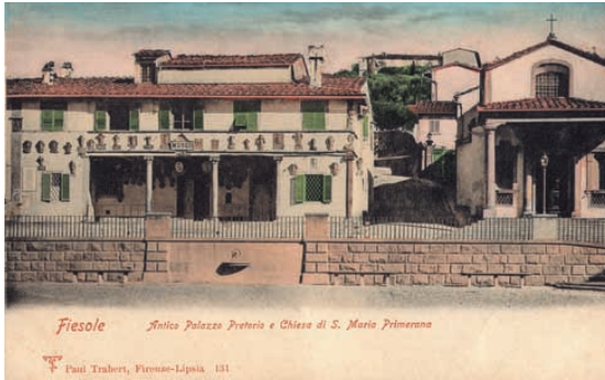
Il Palazzo comunale all'inizio del Novecento in una cartolina d'epoca

del Palazzo comunale, che erano ormai insufficienti per accogliere nuovi versamenti e assolutamente inadatti per permettere la consultazione al pubblico dei documenti.