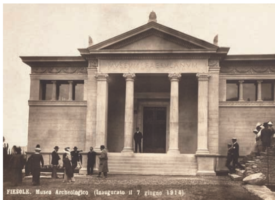
Cartolina commemorativa dell'inaugurazione del Museo archeologico di Fiesole, 7 giugno 1914

È del 1415 l'istituzione della Podesteria di Fiesole alla quale, dal 1424 al 1772, verranno aggregate quelle di Sesto e Brozzi, con l'obbligo per il podestà di risiedere, per sei mesi a turno, a Fiesole o a Sesto, in quanto principali centri abitati della circoscrizione sottoposta al suo controllo;