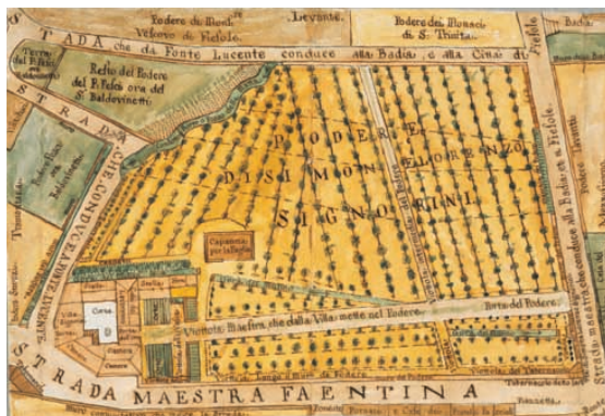
Il podere Signorini a Ponte alla Badia, 1791

stenza. All'alta qualità artistica delle immagini e della grafica ha sicuramente contribuito la collaborazione di numerosi artisti residenti nel territorio comunale che in alcuni casi, ricoprendo anche cariche negli organi di governo locale, hanno partecipato concretamente all'organizzazione di iniziative culturali, influenzando e stimolando così le scelte artistiche dell'Amministrazione comunale. Finora si sono riprodotti complessivamente circa 1400 documenti, fra manifesti e locandine.