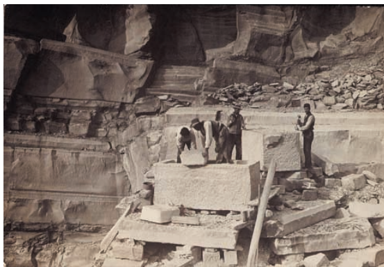
Foto di scalpellini al lavoro nelle cave di pietra serena di Monte Ceceri, 1930 circa

da carteggi, registri, manifesti, fotografie, audio e videocassette, e documenta dettagliatamente l'attività di un ente che, nei diciotto anni della sua esistenza, ha promosso e fatto circolare nuove produzioni teatrali di livello internazionale e dato vita a mostre, spettacoli e manifestazioni varie di innovativo ed elevato livello artistico e culturale.