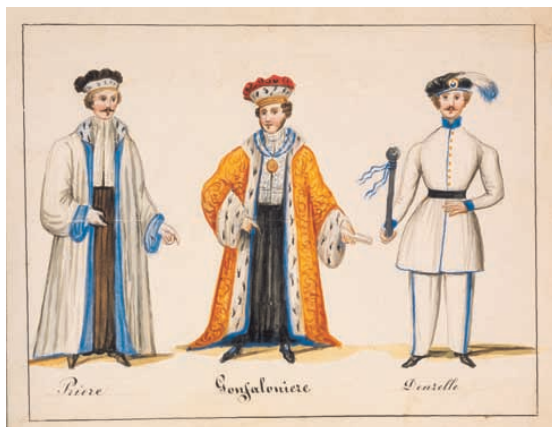
Figurino acquerellato dei costumi che i rappresentanti del Comune di Fiesole indossavano durante le cerimonie ufficiali, 1850 circa

1808 e 1814-1865); Mairie di Fiesole (1809-1814); Ingegneri del circondario di Fiesole (1825-1850); Consiglio di reclutamento del circondario della delegazione di governo del quartiere S. Croce (1853-1860); Consiglio distrettuale (1860-1865). Sono inoltre rimasti i documenti relativi ad alcuni luoghi pii (secc. XVI-XIX) e ad altre comunità (Bagno a Ripoli, Calenzano, Campi, Brozzi, Pellegrino) che per vari motivi sono pervenuti all'archivio.