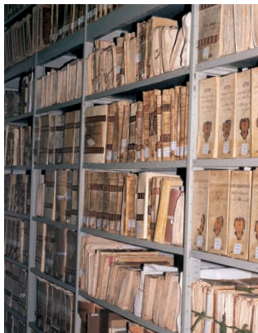
Scaffalature dell'archivio

Precedentemente l'archivio era conservato su scaffalature lignee in alcuni angusti locali situati al piano terreno