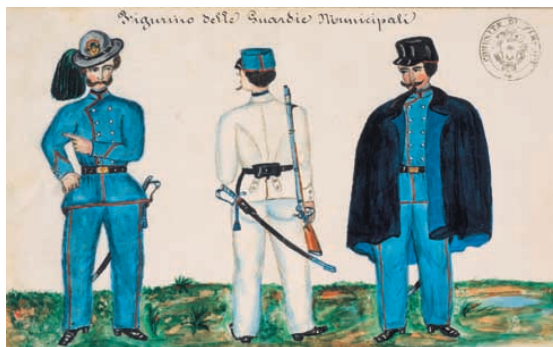
Figurino acquerellato delle divise delle guardie municipali di Fiesole, 1873

Fanno parte dell'Archivio comunale anche alcuni archivi aggregati. Fra questi i più consistenti sono quelli del Giudice conciliatore (1866-1964) e dell'Ente comunale di assistenza (1938-1978); vi sono inoltre piccoli archivi prodotti dall'attività del Patronato scolastico (1958-1978), del Co-