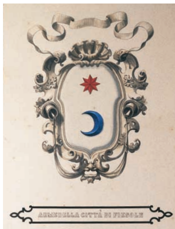
Arme della città di Fiesole, sec. XIX

del loro quotidiano operare nell'archivio. Le deliberazioni degli organi di governo locale, i carteggi amministrativi, i documenti contabili, fiscali e demografici, la documentazione relativa ai lavori pubblici o all'assistenza e beneficenza sono le principali serie conservate nell'archivio comunale. Attraverso questo complesso di carte ampio e vario è così possibile ricostruire, nei suoi molteplici aspetti, lo svolgersi della vita del territorio amministrato e dei suoi abitanti nel corso degli ultimi cinque secoli.