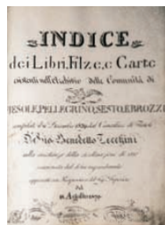
Indice dell'archivio della Cancelleria comunitativa di Fiesole, 1829

Per facilitare la ricerca dei documenti sono state realizzate anche dati informatizzate relative agli atti di più