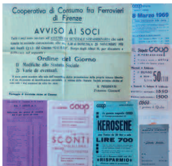
Volantini ai soci, anni '60-'70

È possibile consultare l'inventario attraverso i tre complessi di fondi Cooperative di consumo, Associazioni ricreative e di categoria, Consorzi e Confederazioni , individuare il nucleo e la cooperativa d'interesse e scorrere le serie e le schede archivistiche, oppure svolgere una ricerca libera o avanzata. Ciascuna unità archivistica è identificata da un numero d'ordine che ne permette l'individuazione e il reperimento fisico da parte dell'archivista.