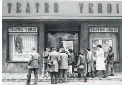
ASUF, Attività istituzionali - Assemblee soci , Teatro Verdi, Firenze 12 dicembre 1984

Un'unica cooperativa si trova a gestire tre diversi canali di distribuzione: minimercati, supermercati ed ipermercati. La gestione dei minimercati è affidata alla So-