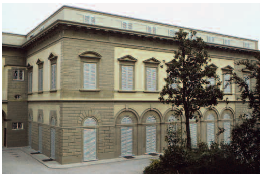
Il Palazzo di via Santa Reparata, cortile interno

Società elettrica del Valdarno e, con la nazionalizzazione delle imprese elettriche, il complesso, nel 1963, divenne proprietà dell'ENEL che lo utilizzò per gli uffici compartimentali, fino al trasferimento in altra sede.