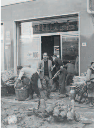
ASUF, sezione fotografica, Iniziative sociali e culturali - Squarci di storia , alluvione spaccio in Pontassieve, 4 novembre 1966

teca comunale di San Casciano Val di Pesa, che ospitava i documenti dell'omonima cooperativa.