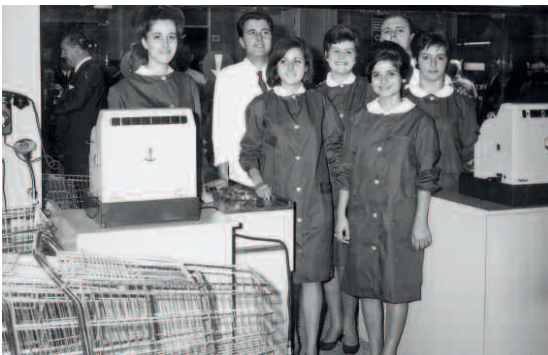
ASUF, Attività istituzionali - Inaugurazione negozi, le prime donne assunte al Supercoop di Empoli, 1963

Unicoop Empoli nel 1963 aveva fondato il primo supercoop, unico esempio nella provincia di Firenze; nel