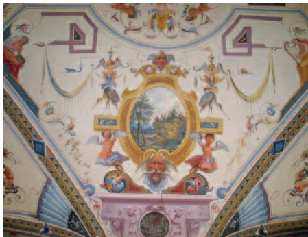
Affreschi nei saloni del Palazzo di via Santa Reparata

La conoscenza approfondita di una cooperativa, la sua legittimazione, la ricerca delle motivazioni dei suoi successi passano anche attraverso la sua storia, testimoniata nei documenti della sua attività; recuperarli, riordinarli, schedarli, collocarli nella sua sede principale, nel cuore pulsante della città, assume un grande valore simbolico, oltre che storico, culturale, etico, sociale ed educativo. Significa garantirne la salvaguardia, la custodia, la conservazione, la fruizione, la valorizzazione per consegnarli ai posteri, affinché ne diventino essi stessi i custodi, attuando un prezioso passaggio di testimone fra generazioni.