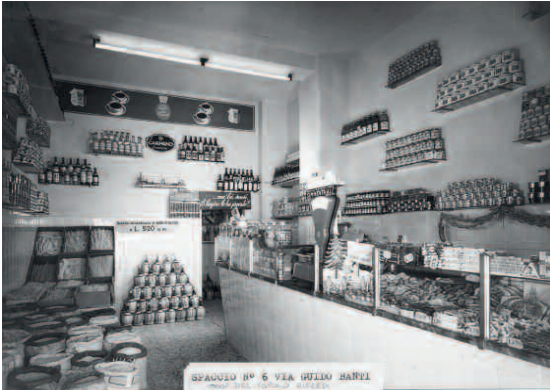
ASUF, Spacci e supermercati – Interni ed esterni , spaccio n. 6 via Guido Banti, Firenze, anni '50

zione spiccatamente proletaria e fortemente radicate al territorio sono anche la Cooperativa Sempre Avanti dell'empolese e il nuovo polo in costante espansione di Bagno a Ripoli e Antella.