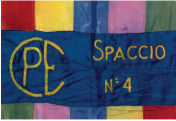
Bandiera dello spaccio n. 4 della Cooperativa del Popolo di Empoli, anni '50

ti nuclei documentari, riuniti in un unico complesso archivistico, prodotti dalle singole cooperative di consumo che, nel corso degli anni, sono confluite in Unicoop Firenze.