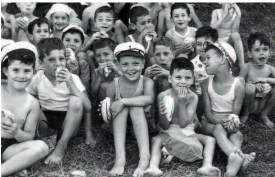
ASUF, Iniziative sociali e culturali – Attività ricreative , Alleanza cooperativa della Valdera, le cooperative offrono una sana ricreazione, anni '50

L'ASUF può essere definito in termini tecnici un archivio di concentrazione: nasce infatti dall'insieme di tan-