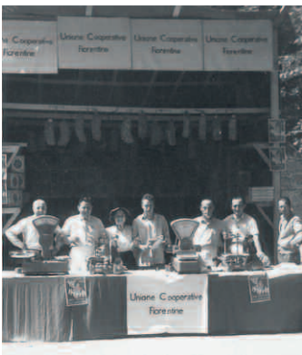
ASUF, sezione fotografica, Spacci e supermercati - Interni ed esterni , Unione Cooperative Fiorentine, stand Cooperativo, anni '40

va di consumo di Sesto Fiorentino. La Cooperativa mostra, fin dall'inizio, una particolare vivacità, per la sua base popolare, operaia e socialista e anche per le abilità gestionali del gruppo dirigente. In questa cooperativa si concentra quell' humus fertile che le permetterà di resistere a eventi tragici come l'avvento del fascismo e la seconda Guerra mondiale, di crescere e di evolversi.