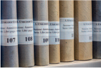
Documenti a scaffale, Libri paga , Unicoop Empoli

ca, frutto di materiali di provenienza diversa, si presentava in uno stato di notevole disordine. Le fotografie erano raccolte in faldoni, privi di ordinamento, non datate e quasi completamente mancanti di didascalie. L'impossibilità di ricostruire il vincolo archivistico fra le fotografie e la documentazione a cui si presume fossero legate, ha reso necessario trattare la sezione fotografica come una raccolta . Nei casi, invece, in cui è stato possibile ricostruire questo legame ne è stata data notizia nella descrizione, attraverso un rimando.